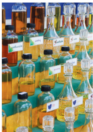
תמציות בשמים

יועץ הבישום של בית גרלן. למותג היתה השפעה עצומה על התפתחות אמנות הבישום, כשנצרו למשפחת גרלן הקים את האוניברסיטה הראשונה של הבישום הפועלת עד ימינו בוורסאי.