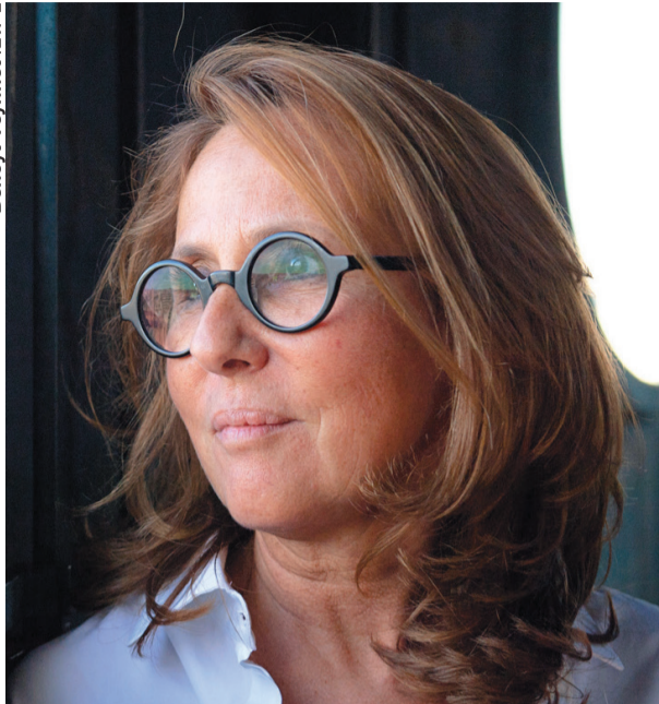
כריסטין נאז'ל, אמנית הבישום של הרמס